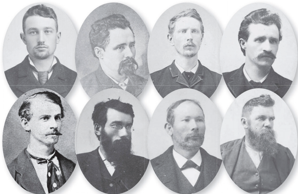
Los condenados de Haymarket: Louis Lingg, Oscar Neebe, Adolph Fisher, August Spies, Albert Parsons, Michael Schwab, George Engel y Samuel Fielden. Todos condenados a muerte y asesinados por el Estado el 11 de noviembre de 1887, excepto Neebe (15 años de prisión), Fielden y Schwab (condenados a cadena perpetua).